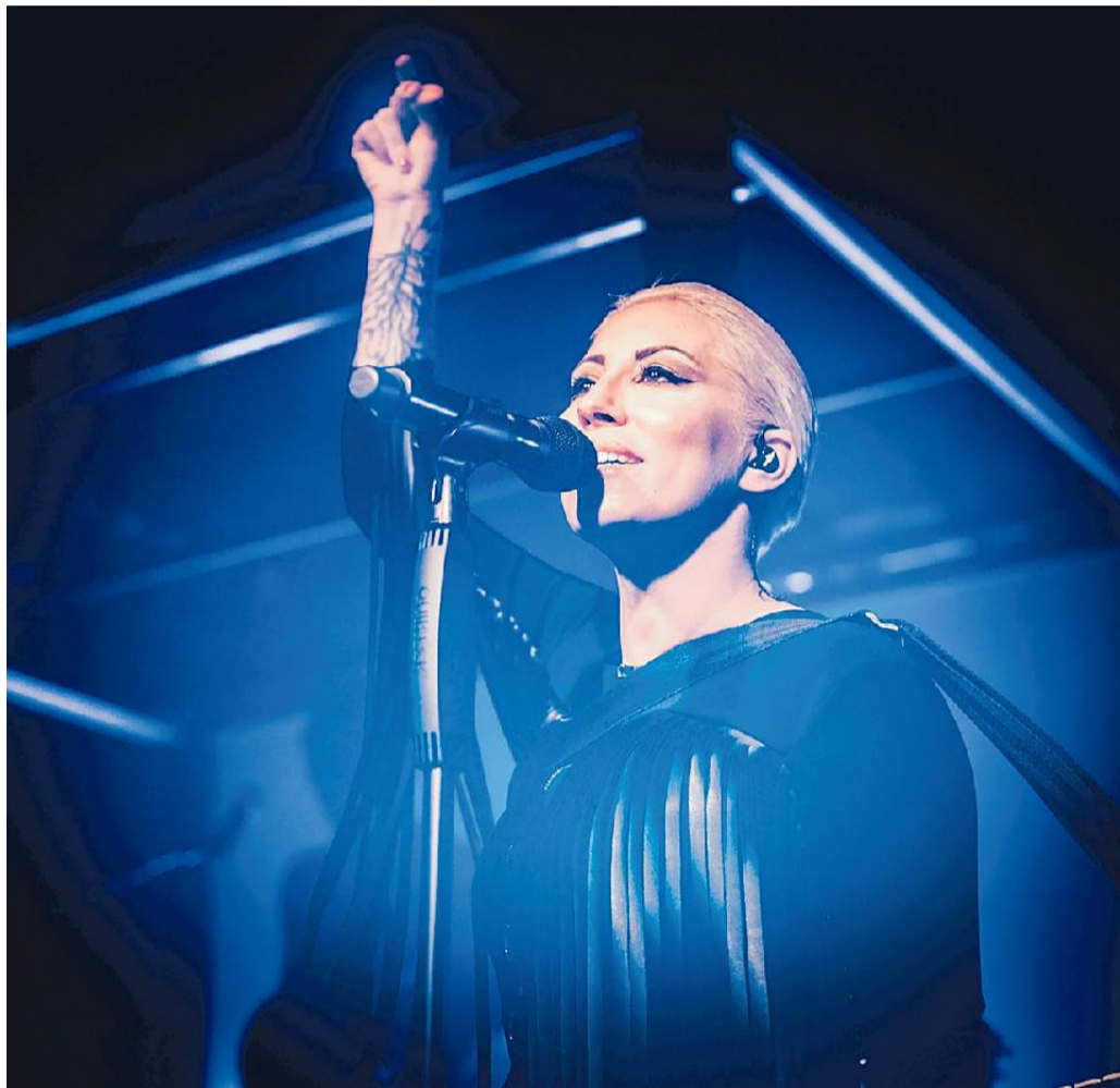
La testimonial della 28a edizione della Festa della musica sarà la cantante Malika Ayane

Appuntamento il 21 giugno con 19 incontri in dieci città nella nostra regione. Sono oltre 5 mila gli artisti iscritti all'evento. Ecco come partecipare all'evento